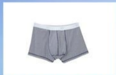
MUTANDE DA UOMO