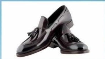
LE SCARPE DA UOMO