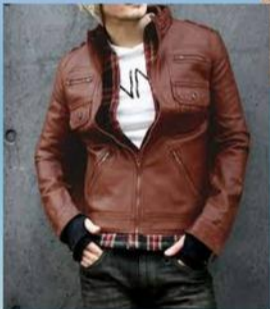
GIACCA DI PELLE