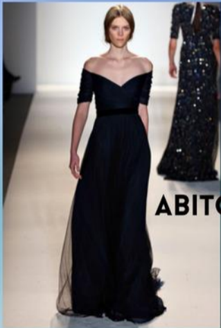
ABITO DA DONNA