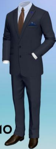
ABITO DA UOMO