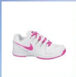
LE SCARPE DA TENNIS