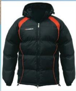
GIUBBOTTO/ GIUBBINO PIUMINO