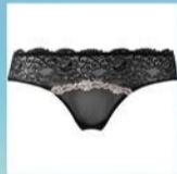
MUTANDE DA DONNA