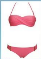
COSTUME DA BAGNO